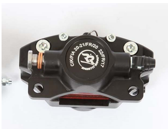
Etriers / Calipers