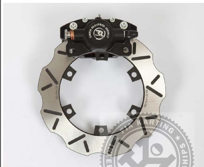
Photo du frein arrière : étrier(s) et disque(s) seulement Photo of rear brake: caliper(s) and disc(s) only

Photo du frein avant : étriers et disques seulement Photo of front brake: calipers and discs only