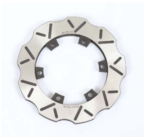
Disques / Discs