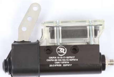
Maître-cylindre / Master-cylinder