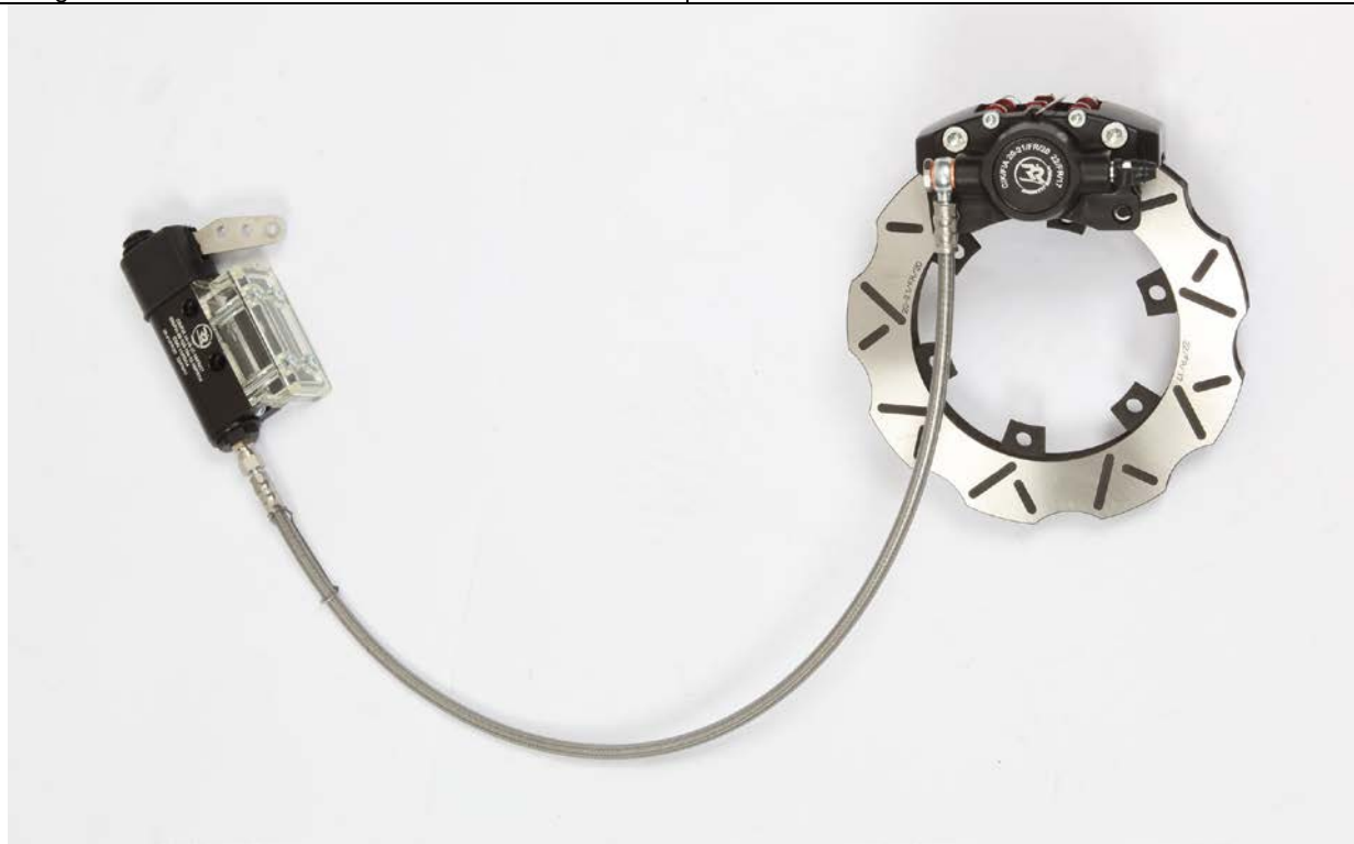
PHOTO VUE DE DESSUS DU SYSTÈME COMPLET ASSEMBLÉ

This Homologation Form reproduces descriptions, illustrations and dimensions of the brake system at the moment of the CIK-FIA homologation. The Manufacturer may modify them, but only within the limits set by the CIK-FIA Regulations in force.