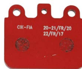
Plaquettes / Pads